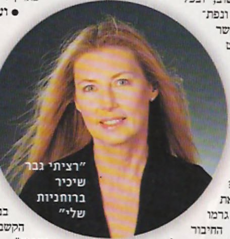
"רציתי גבר שיכיר ברוחניות שלי"

"כל החיים רציתי גבר שיכיר ברוחניות שלי וגם יתחבר אליה. לא מצאתי אדם כזה. בעלי המנחם הגיע לזה רק בתקופת מחלתו, בסוף חייו. הקשר המרגש ביני שאנחנו רוצים לחלוק אותה עם אחרים, לחבר אנשים לעצמם ולהעמיק את הקשר בינם ובין הסדר בביתם, ממקום של הקשבה ודיבור מהלב, בלי שיפוט."