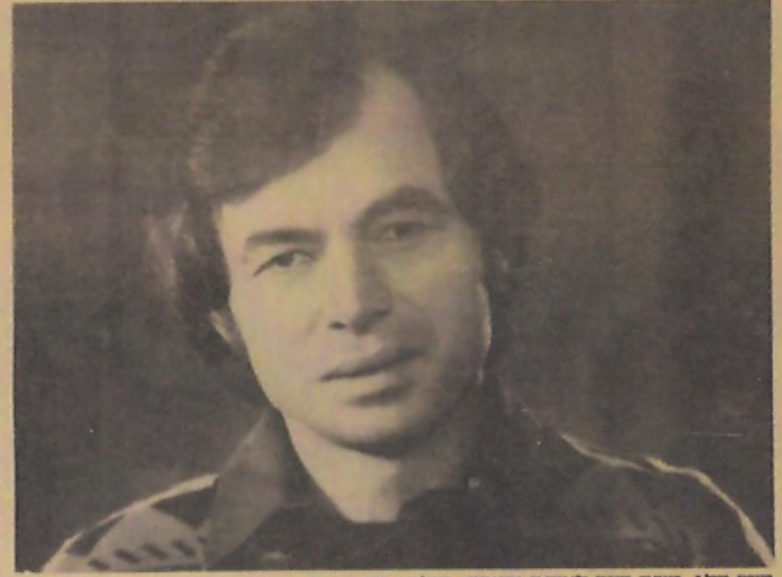
פלג כזמר, בהופעה אול קהל של יהודים בוז גרין